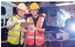
リアルタイムでのデータ確認に