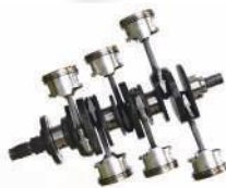
これまで計測できなかった場所に