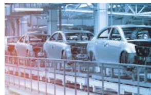
製造ラインでの温度管理に