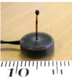
小型・ロープロファイルのキャンドルスティックセンサ