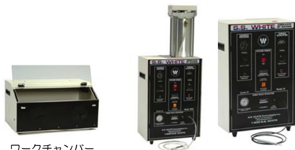
ワークチャンバー