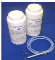
パウダー&ノズルホース