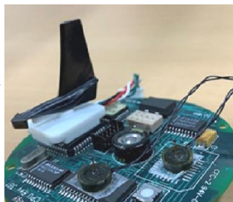
超小型環境センサと風速温度センサとの併用例