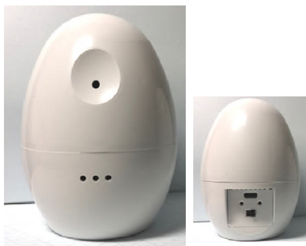
SPM-101 外観写真 (寸法 φ75mm x H 100mm)