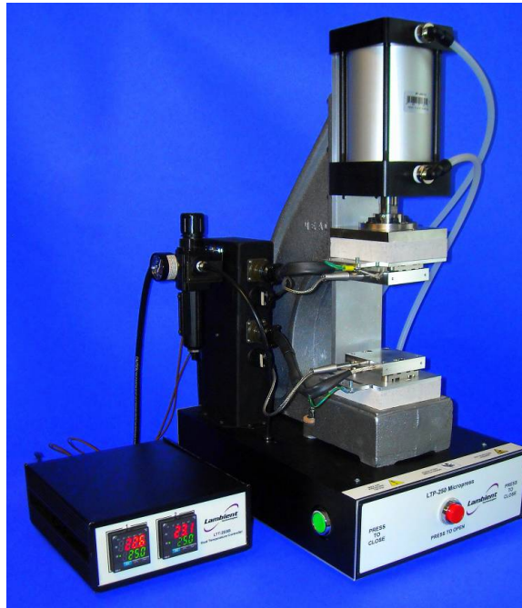
LTP-250 マイクロプレスと LTT-203B 温度コントローラー

新製品の LTP-250 マイクロプレスは材料に加熱・加圧ができる小型の卓上空圧プレスです。上下のプラテンの温度コントローラーを利用してもしなくても使用できます。プラテン温度のプログラム制御も可能で、温度範囲は室温から 350℃、最大加圧は約 680Kg、プラテンエリアサイズは 75mm x 75mm です。